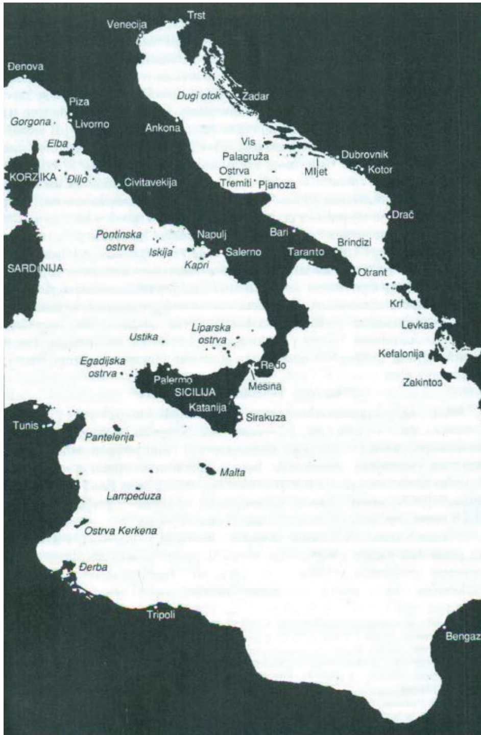
Slika 1: Fernan Brodel: „Sicilija i Tunis presecaju Mediteran“ 11